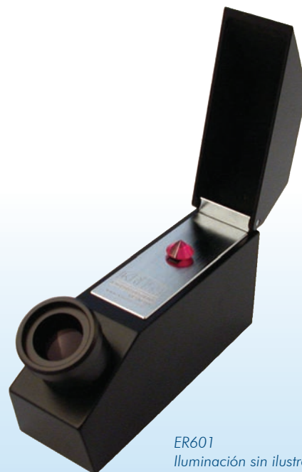
ER601 Iluminación sin ilustración

El índice de refracción constituye una magnitud importante para la determinación de minerales o piedras preciosas: cada mineral tiene su propio índice de refracción característico, según su composición química y estructura cristalina. Nuestro refractómetro de piedras preciosas destaca por proporcionar imágenes especialmente nítidas y por una gran facilidad de lectura. Gracias al filtro de sodio, que permite el paso únicamente de luces con longitud de onda de 589 nm, el refractómetro móvil puede utilizarse con una fuente de luz convencional o con suficiente luz ambiente. Además existe iluminación LED con longitud de onda de 589 nm.