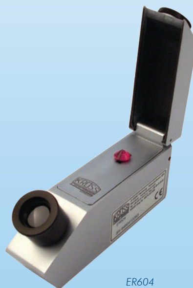
ER604 Iluminación sin ilustración