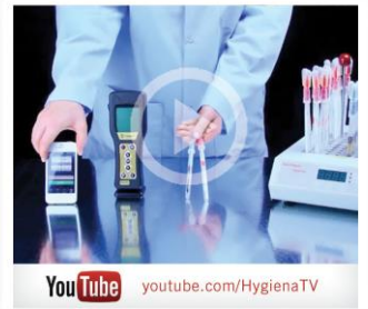
Observe un demo de instrucción en youtube.com/HygienaTV

MicroSnap Coliform es una prueba rápida para la detección y enumeración de la bacteria de Coliformes. La prueba utiliza una reacción bioluminiscente noble que genera luz cuando las enzimas que son características de la bacteria de coliformes reaccionan con sustratos especializados. La señal de generación de luz se cuantifica con el luminómetro EnSURE. Los resultados están disponibles en 8 horas o menos, dependiendo del nivel de detección requerido. Organismos de una sola cifra pueden ser detectables en 8 horas, entregando resultados en el mismo día de trabajo o turno.