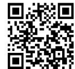
Encuentre documentos de apoyo, videos de instrucción y más en www.hygienea.com