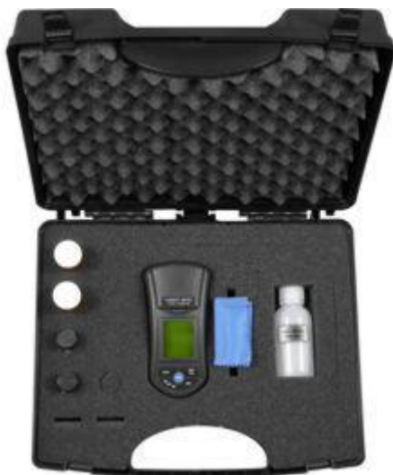
Turbidímetro PCE-TUM 20 en su maletín con accesorios