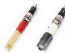
pH, mV OD

Longitud de sonda disponible en 4, 10 y 20 m.