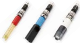
pH, mV CE OD