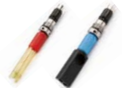
pH, mV CE