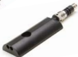
Turbidez según ISO7027