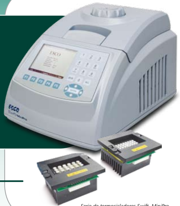
Serie de termocicladores Swift, MiniPro