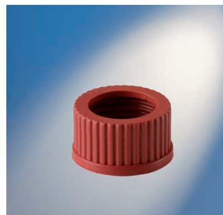
16 20 40